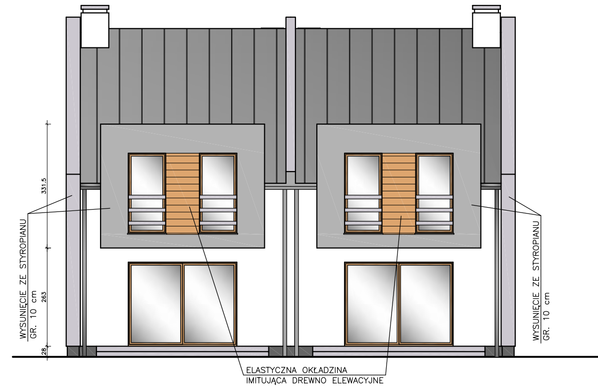
ELEWACJA TYLNA – POŁUDNIOWA